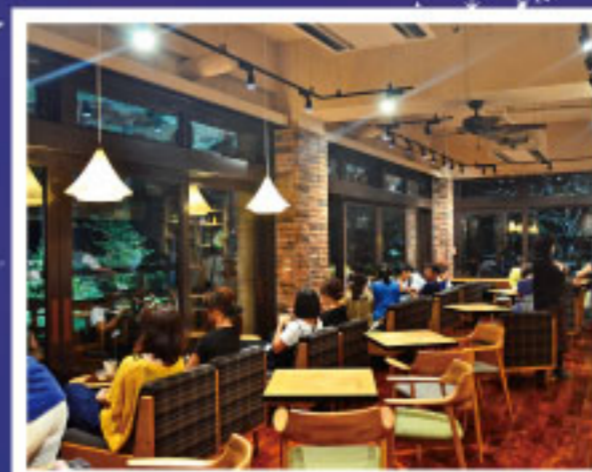
記念の森レストハウス