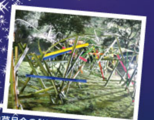
草月会の「竹アート」