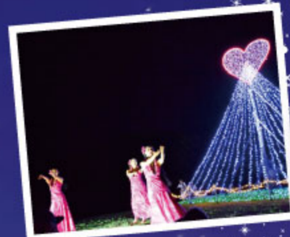
フラダンスショー

第2回「light of the four seasons」と題 しオリジナル曲で四季を表現。BGMと光の シンクロが初めて行われました。期間中は、 演奏会やクラフト体験、天体観測など夜な らではのイベントを数多く開催するようにな りました。