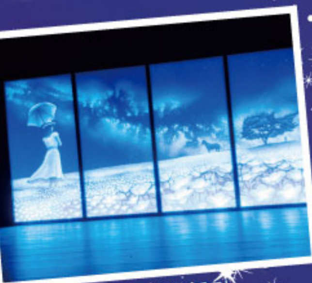
光彫り作品「ネモフィラが咲く丘で」

第5回テーマ「COLOR」。 リニューアルした記念の森 レストハウスを夜間オープン。