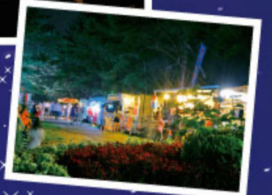
キッチンカーが初登場