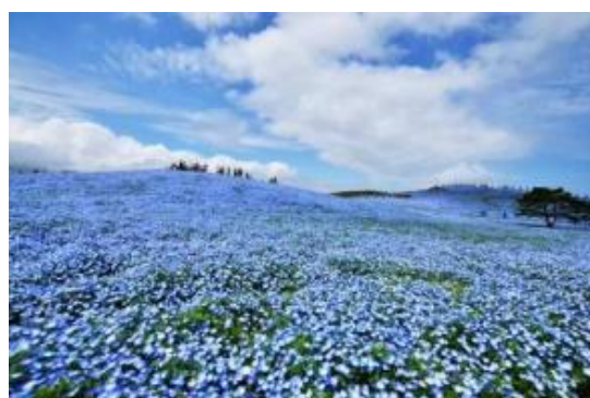
4月中旬～5月上旬見頃