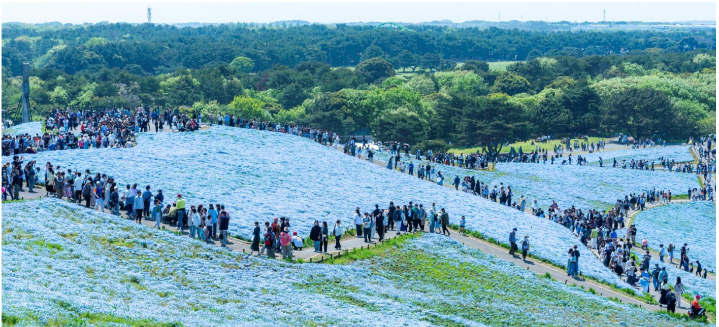
「みはらしの丘」春の利用状況 撮影/2025年5月1日

令和8年度も、安全・安心で多様な公園利用を提供するとともに、地元自治体や周辺施設との協働による地域全体の活性化を目指した公園運営に努めて参りますので、引き続き取材ならびに記事掲載のほど、よろしくお願い申し上げます。