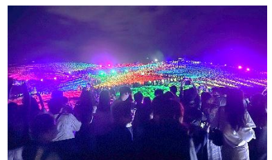
コキアライトアップ (2025年9月21日撮影)

コキアライトアップは音楽アーティストとのコラボを加え、過去最高の来場者数（76,326人）を記録し、月別では9月が歴代2位となりました。11月は各種イベントの開催および天候にも恵まれ、歴代2位を記録。冬季はアイスチューリップやドッグランの期間延長、初開催「Sippo Festa」などの取組が好調で、入園者数の底上げにつながりました。