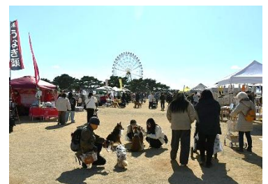
初開催となった犬のイベント「Sippo Festa」 (2026年3月8日撮影)

【12~3月】 …… スポーツイベントや初開催の「Sippo Festa」、「期間限定ドッグラン」の期間延長、「アイスチューリップ」や「早咲きスイセン」目的で利用増。