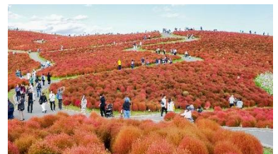
「みはらしの丘」秋の利用状況 (2025年10月27日撮影)

コキアの紅葉が見頃を迎えた 10月 は、250,504人（対前年比69.2%）と前年を大幅に下回りました。本来、多くの利用者が来園する時期であるものの、週末ごとの天候不順の影響が大きく、年間入園者数を押し下げる要因となりました。